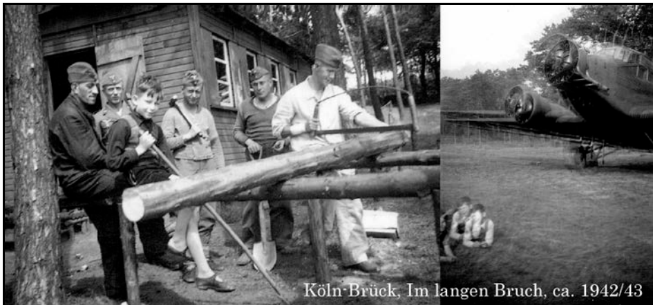
Köln-Brück, Im langen Bruch, ca. 1942/43